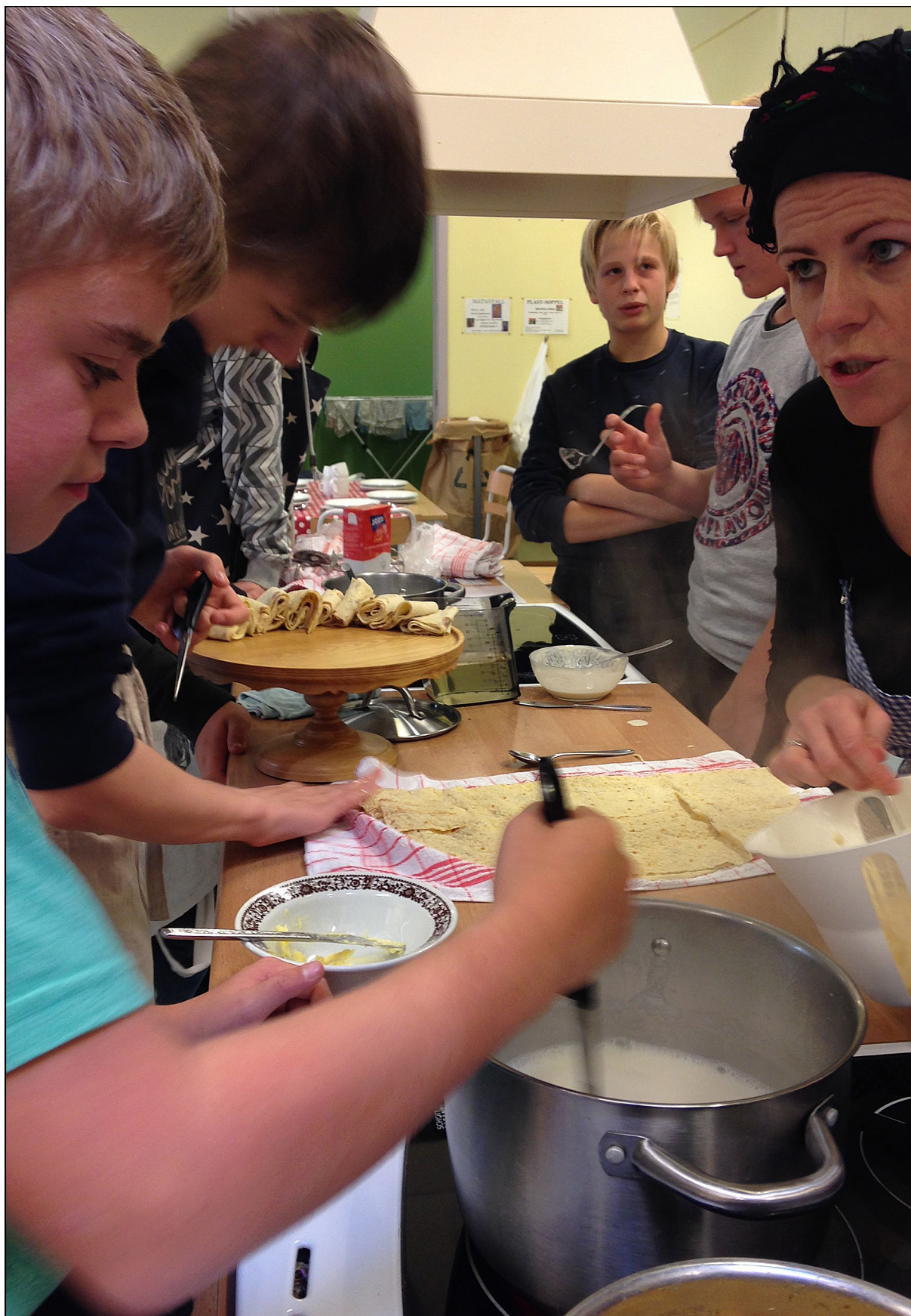
På turne med Den kulturelle skolesekken. Tradisjonsmat frå Setesdal står på menyen.