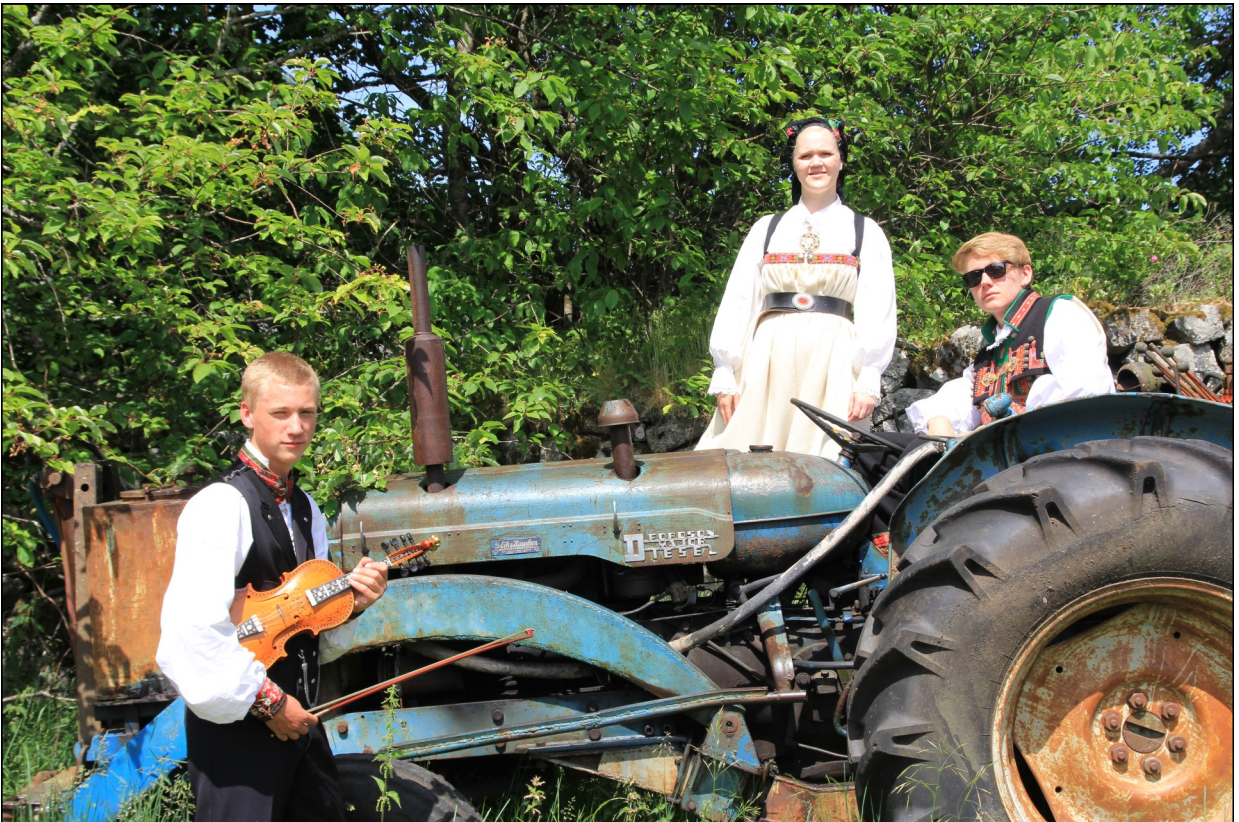
Over: Frå utstillingane på Sylvartun der folkemusikk og -dans har fått ein ny arena for sine aktivitetar. Under: Kulturpatrulja er eit triveleg innslag på sommaren.