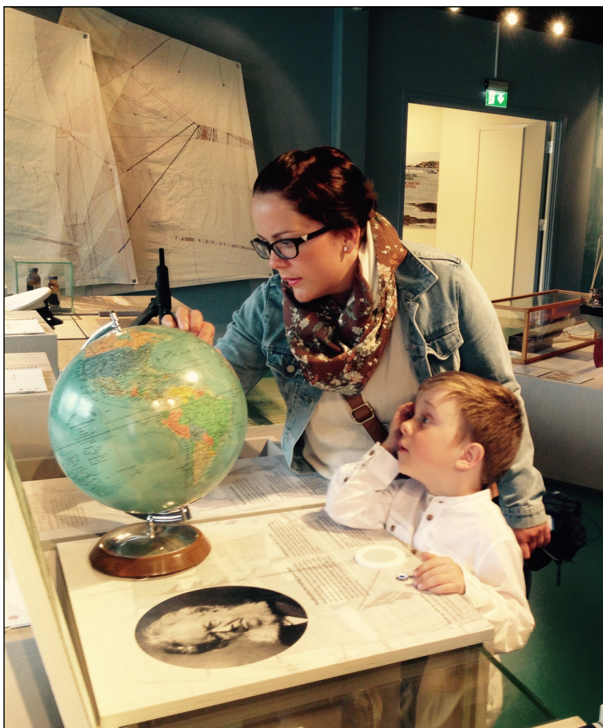
Ivrige gjester på besøk i Grimstad.

Det har vore tre tilfelle av innbrot i nybygget på Kuben, der det vart stole to berbare PC-ar og to mobiltelefonar med tilbehør. Alt blei meldt til politiet.