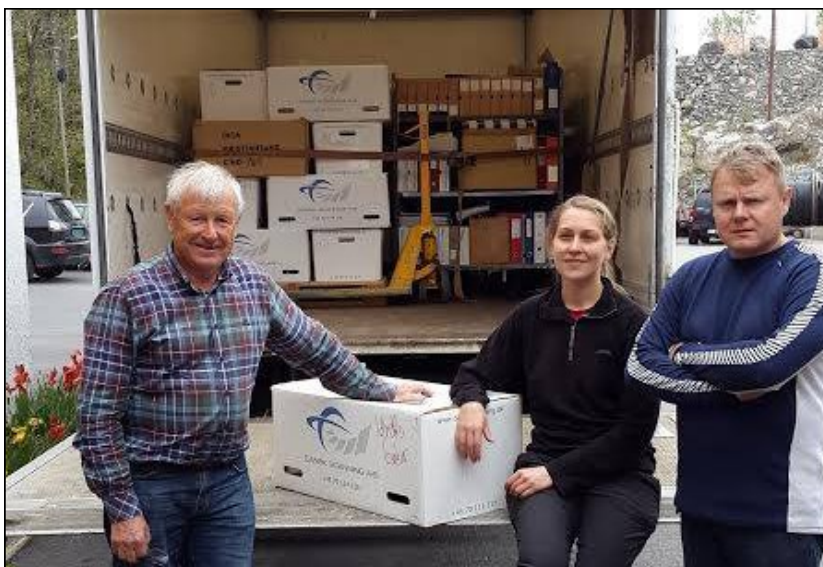
Over: Arkivformidling har gitt mange avisopplag i lokalpressen i 2015.