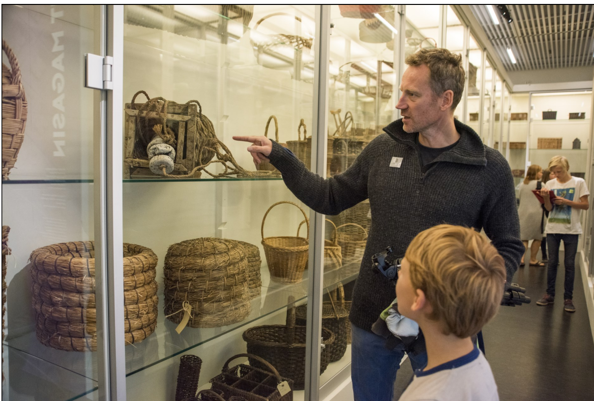
Osellas kokebok sine oppskrifter må testast ut før dei vert lagt ut på bloggen. Eit nytt og populært tilbod på Kuben er "Åpent magasin".