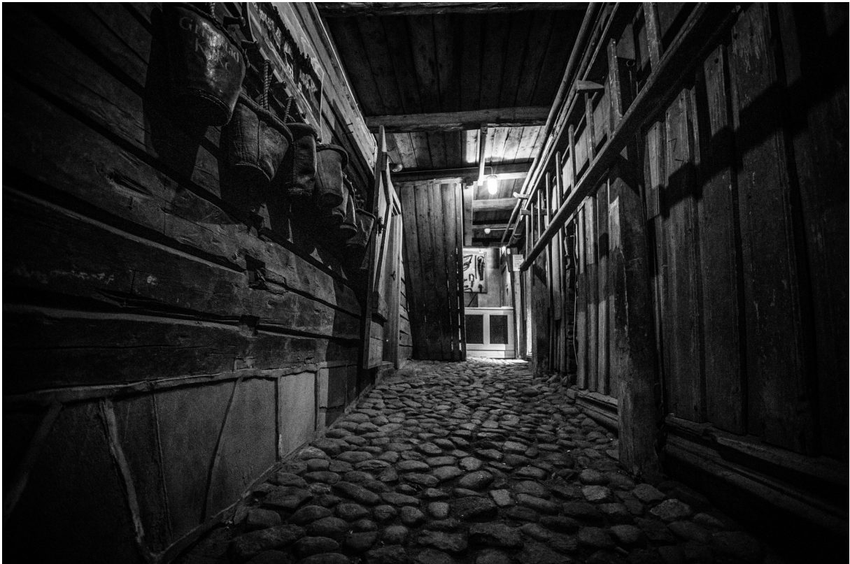
Over: Eplesamlinga på Hagebruksmuseet.