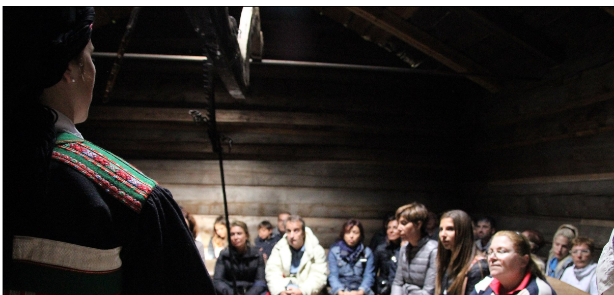
Oppe: Hamsuns postkasse. Nede: Cruisegjester på besøk i årestoga på Bygland museum.