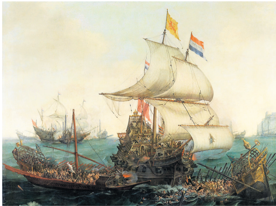
KAMP: Et nederlandsk orlogsfartøy vedrer en spansk galei utafor kysten av Flandern i oktober 1602. Maleri 1617 av Hendrick Cornelisz Vroom.

Men i København satt en såre fornøgd Fredrik II og gleda seg over at han atter hadde fått en kriger etter sitt hjerte. Fredrik var trulig dyslektiker og ikke særlig