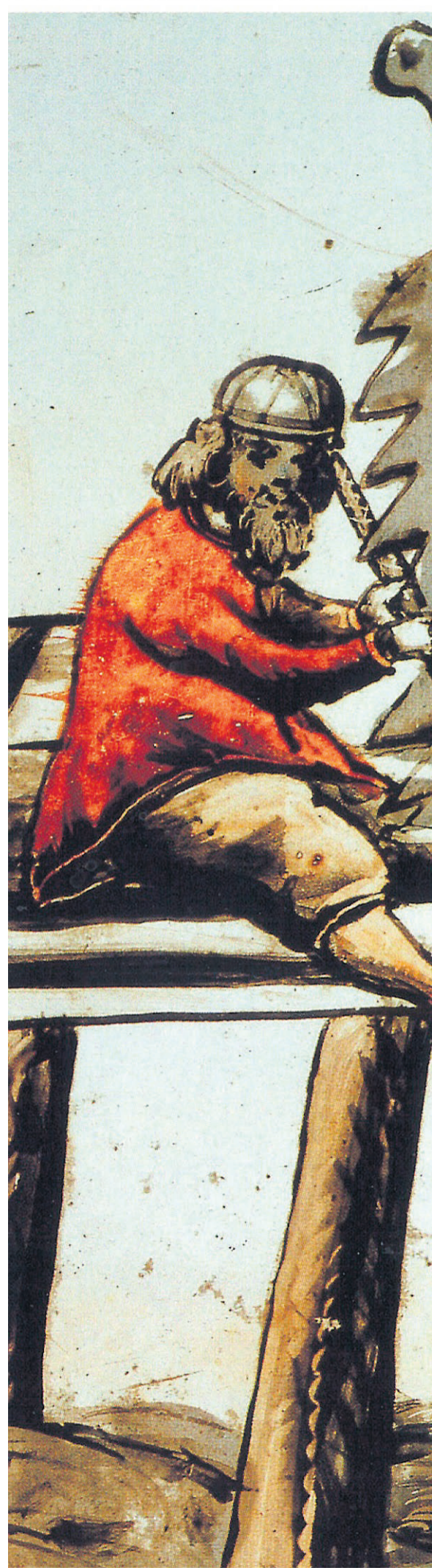
SAGSKJÆRERE: Kong Fredrik hadde bruk for mange sagskjærerne opp bladet, mens ei kone skjenker ham øl,