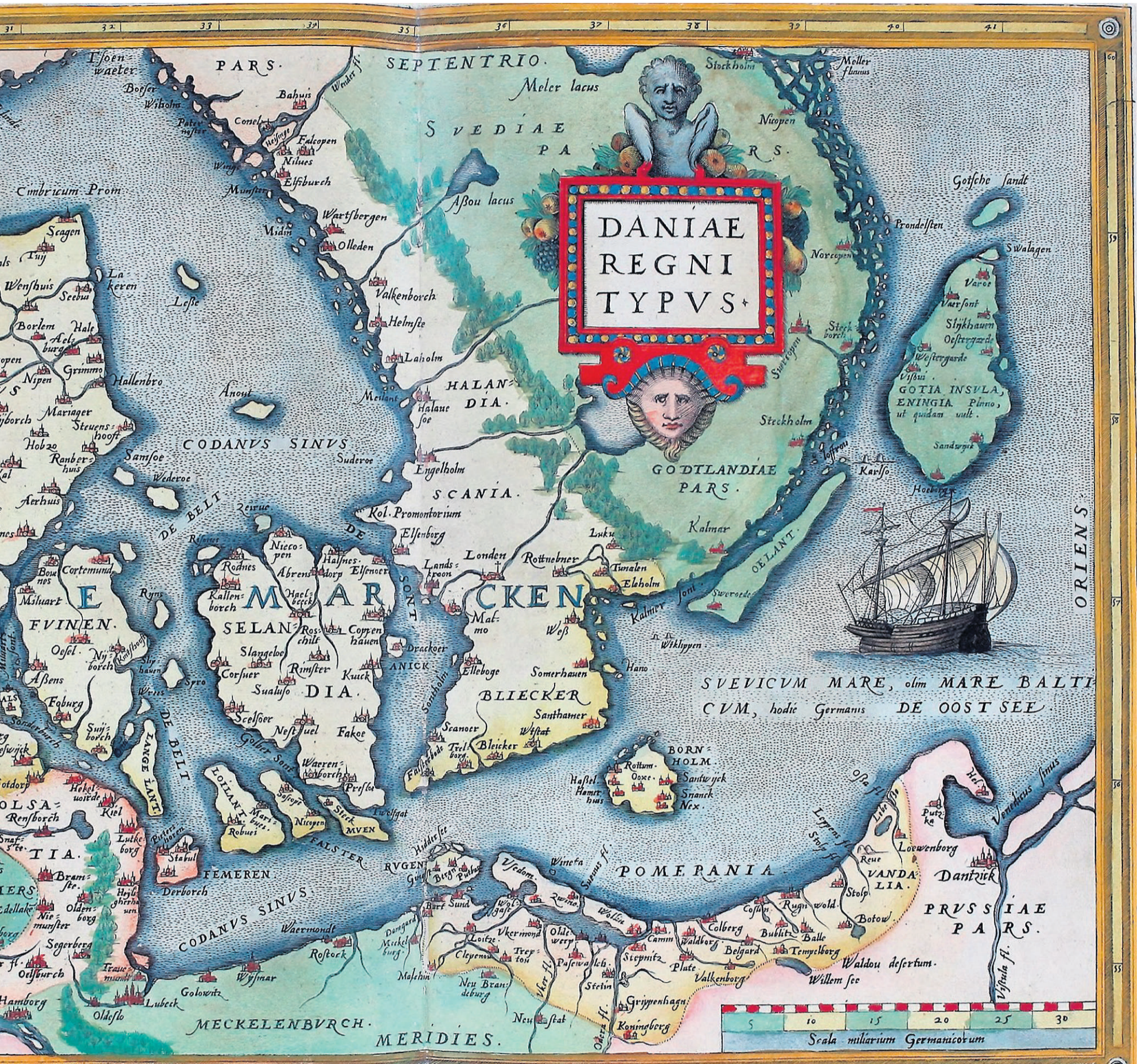
Munk vokste opp ved Varberg, noen mil sør for Gøteaelvens utløp. Atlas Ortelius av Abraham Ortelius fra 1571 med redaksjoner fra 1573, 1579 og 1584.