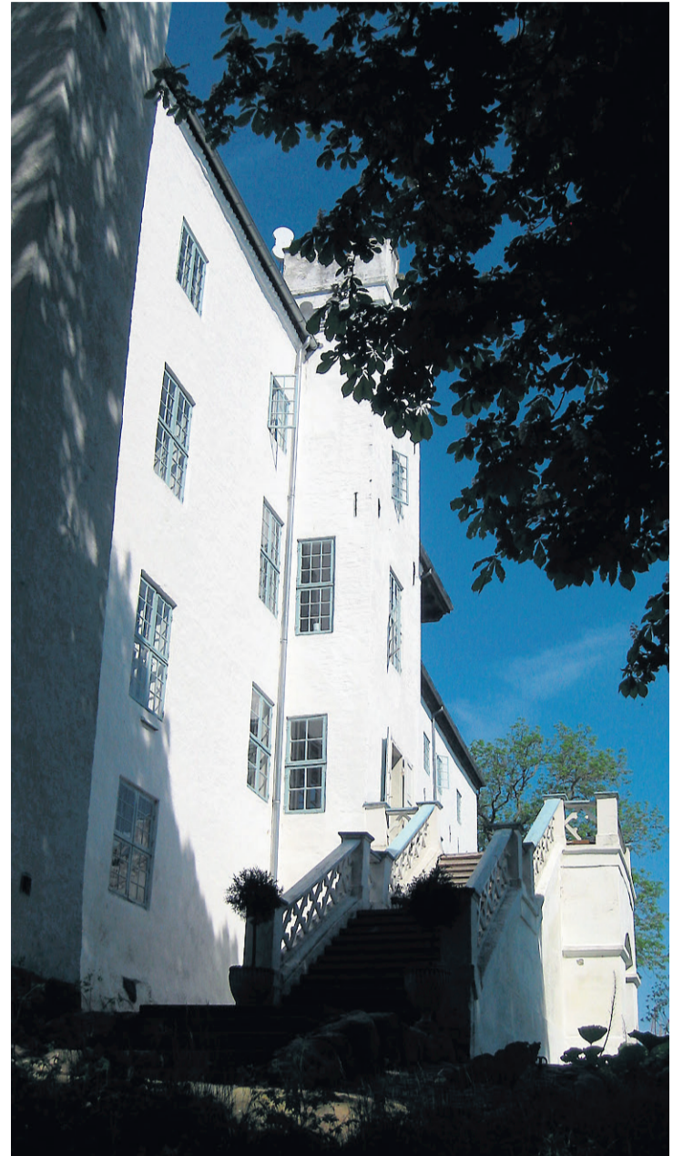
SLOTTET: Dragsholm slott.