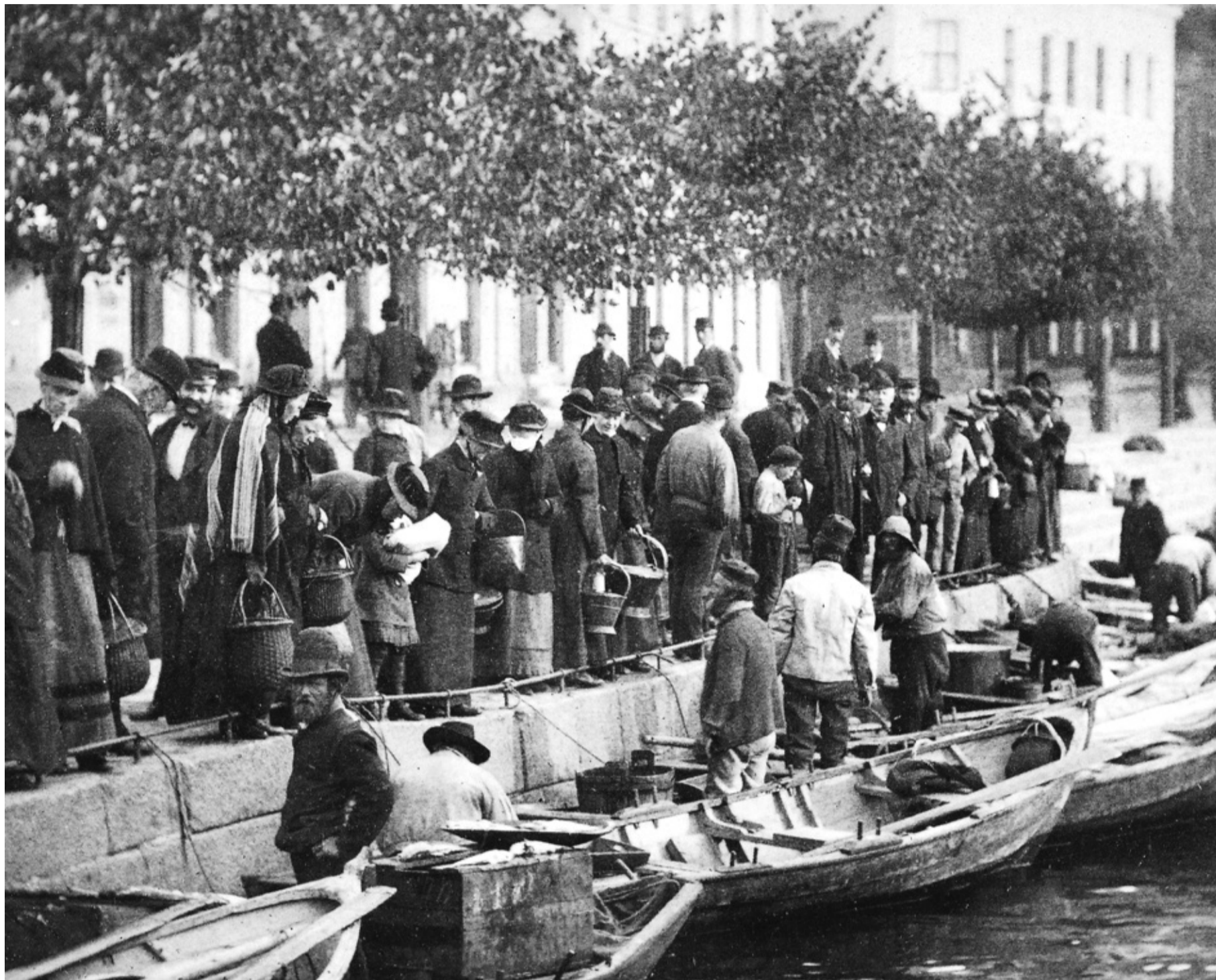
SE TORSKEN: Fiskebrygga i Arendal, ca. 1884. Økte omsetningen av torsk etter utsetting av kunstig utklekket yngel fra Flødevigen? Det var det store spørsmålet.