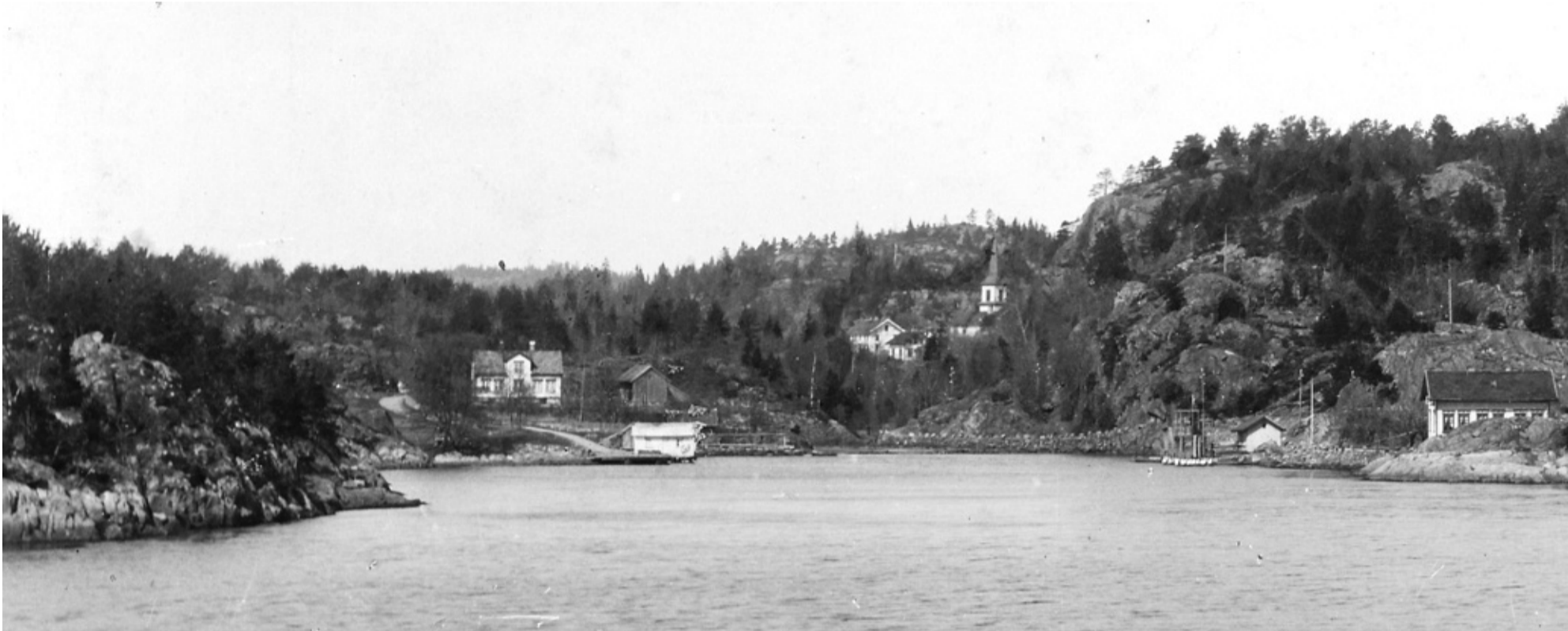
FLØDEVIGEN: Ca. 1905. Røyken fra anstaltens pipe indikerer at utklekkingen er i gang.

Denne artikkelen er ikke skrevet av en journalist i Agderposten, og er derfor ikke fri og uavhengig journalistikk. Artikkelen er i sin helhet laget av en ekstern bidragsyter. Vi har funnet innholdet interessant for våre lesere, og publiserer det derfor redigert og tilrettelagt av redaksjonen. Det betales ikke honorar for slike artikler.