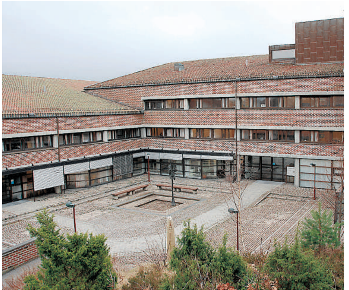
Fylkeshuset på Fløyheia.