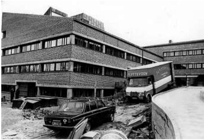
Innflytting i 1977.