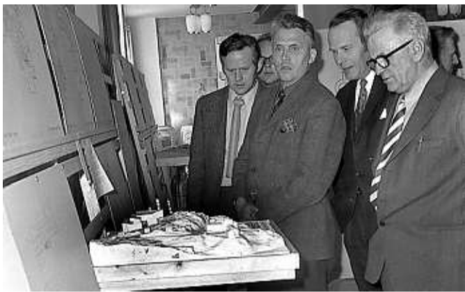
Visning av modellene i arkitektkonkurransen, 2. april 1973 i aulaen på Sjømannsskolen.