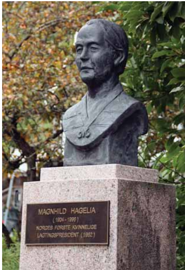
Byste i bronse laga av Arne Vinje Gunnerud, utanfor Grimstad Rådhus.

naturlig å vise utad. Og det forsterket seg med årene, helt til det aller siste av hennes lange liv». Han viste også til at ho i mange år hadde vore med i Kristne Arbeiders forbund, og var ein av veteranane der.