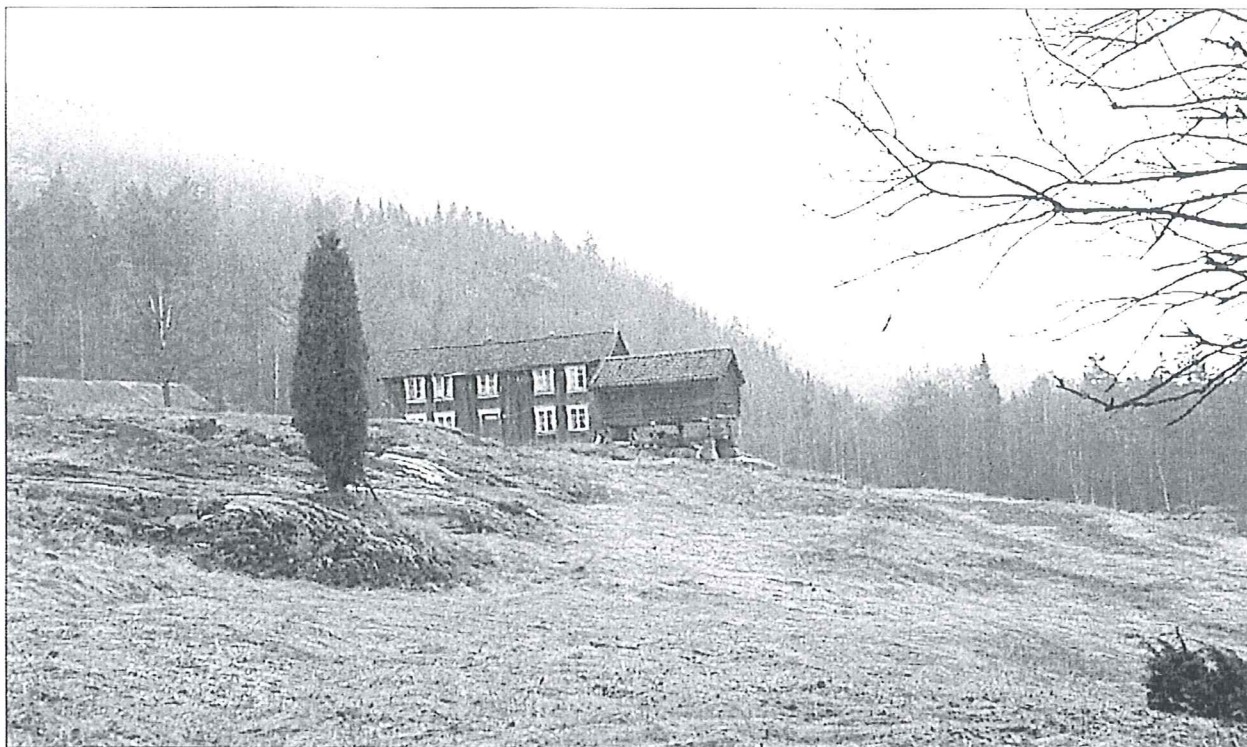
Vestre Fiskvatn sett frå sør.