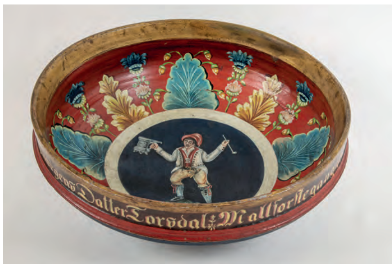
Malt (spira og importert bygg) til ølbrygging ble også importert i større mengder og solgt til befolkningen. Her en ølbolle med mulig opprinnelse fra Gjerstad 1762. AAM.15273.

Det var bygg og noe havre som ble dyrket i Nedenes, kornslag som ikke kunne brukes til gjæret brød. Den importerte rugen kunne deri-